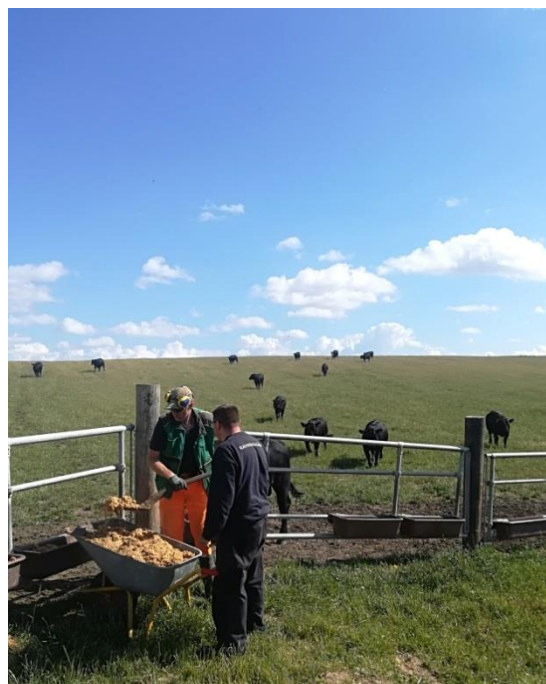
Drengene fra Ravnhøjgård fodrer køer. Altid glade kunder ☺

Biograftur i efterårsferien, hvor planen var noget andet, men da det regnede hele dagen, så det blev en tur i biffen i stedet for.